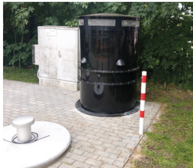
Filter zur Geruchsentfernung aus der Abluft eines Kanalschachtes

GoSorp® G-X wird als Markenprodukt in einer der modernsten Produktionsstandorten für Aktivkohle der Welt unter Berücksichtigung hoher Qualitätsstandards hergestellt.