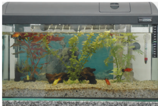
Aquarium mit Ferrosorp®-Filter