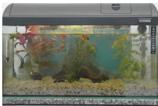
Aquarium ohne Ferrosorp®-Filter