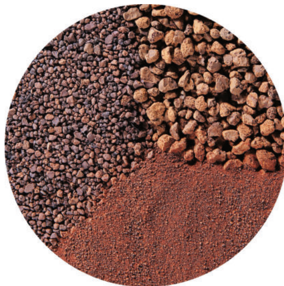
FerroSorp® Plus in verschiedenen Kornbereichen

FerroSorp® Plus ist ein hochleistungsfähiges Adsorptionsgranulat auf Basis von Eisenhydroxid. Es wurde speziell für die adsorptive Entfernung von Phosphat und Silikat aus Wässern von Süß- und Meerwasseraquarien sowie Gartenteichen entwickelt. Als Filtermedium ist es aufgrund seiner großen und hochporösen Oberfläche in der Lage, Phosphat-Ionen rasch, effektiv und irreversibel zu binden. FerroSorp® Plus wird in unterschiedlichen Kornbereichen angeboten und gestattet somit einen Einsatz sowohl in speziellen Filterkartuschen, die nach dem Prinzip des Festbettfilters arbeiten, als auch in Filterbeuteln, die in praktisch jedem Mehrschichtfilter eingesetzt werden können. Neben Phosphaten und Silikaten werden vom FerroSorp® Plus auch schädliche Schwermetall-Ionen wie z.B. Blei, Kupfer und Zink gebunden.