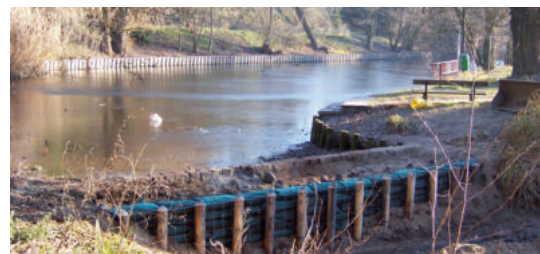
„Nährstoff-Falle“ mit FerroSorp® GW (2 - 4 mm) in Filtersäcken