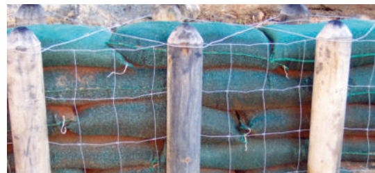
Detailansicht der Barriere aus Filtersäcken