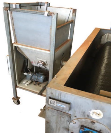
Adaptierter Pulverdosiierer einer Polymeraufbereitungsstation zur gesteuerten, sackweise Dosierung von FerroSorp ® DG+ in den Abwurfschacht der Schlammentwässerung

oder über den Lagertank der Co-Substrate